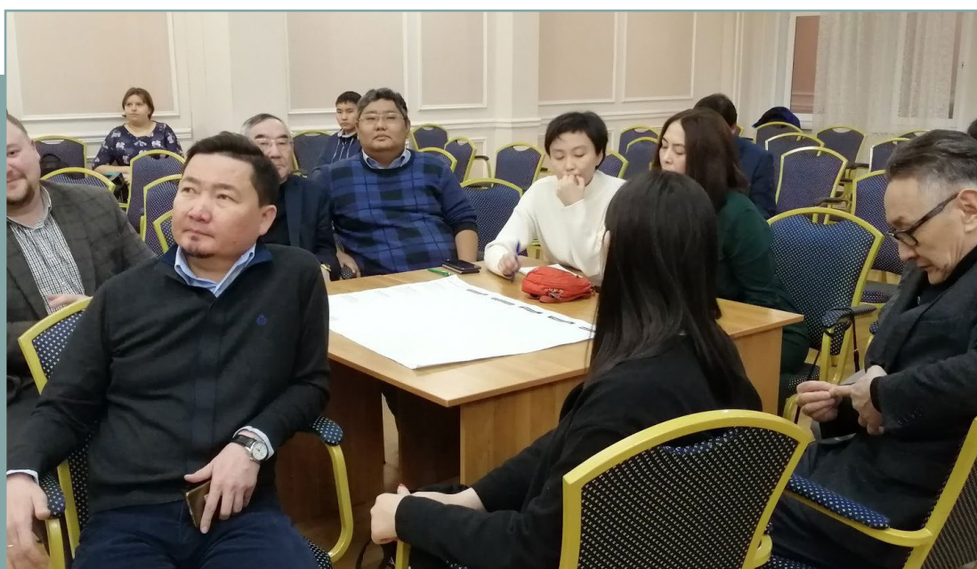
Проектная сессия в г. Улан-Удэ по подготовке стандарта. 25 ноября 2019 года