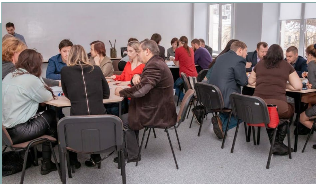
Проектная сессия в г. Тюмень по подготовке стандарта. 30 января 2020 года