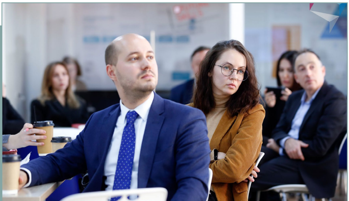
Проектная сессия в г. Москва по подготовке стандарта. 13 ноября 2019 года