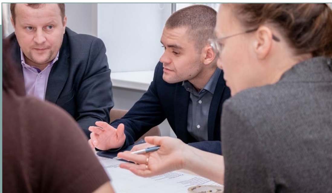
Проектная сессия в г. Тюмень по подготовке стандарта. 30 января 2020 года