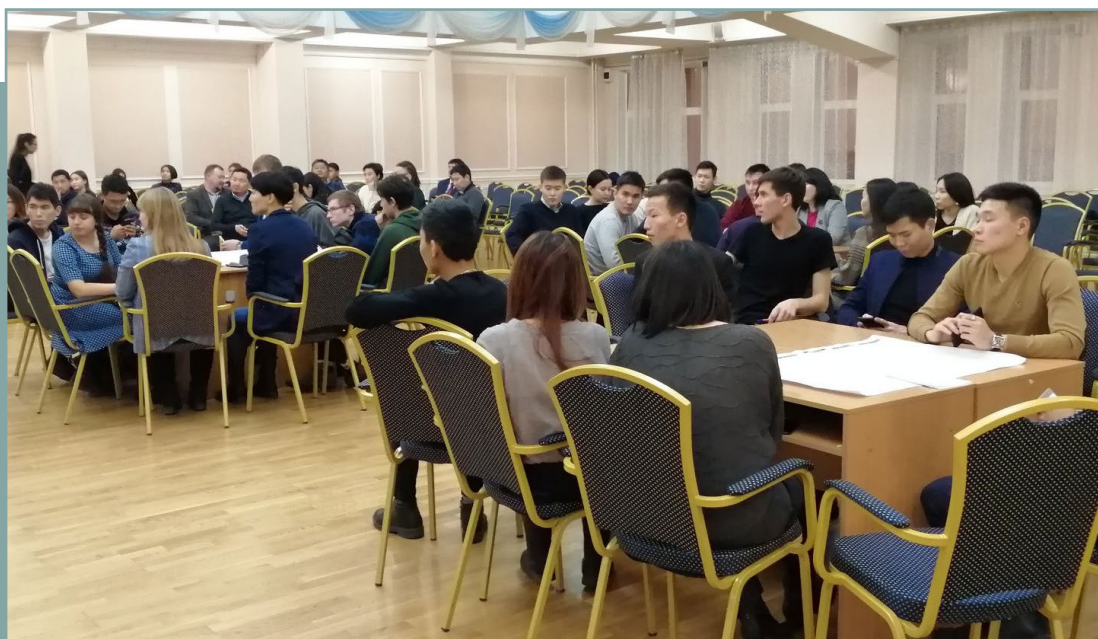
Проектная сессия в г. Улан-Удэ по подготовке стандарта. 25 ноября 2019 года