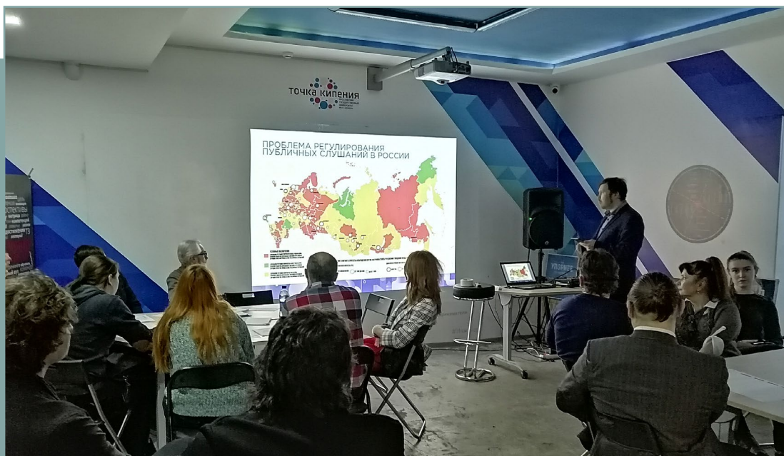
Проектная сессия в г. Ярославль по подготовке стандарта. 30 января 2020 года