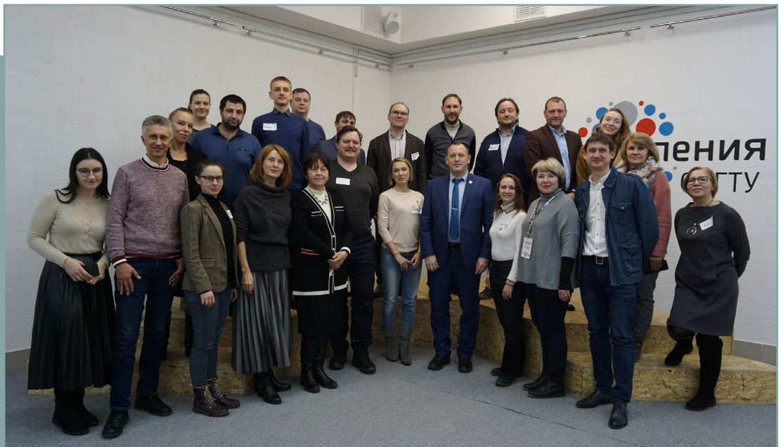
Проектная сессия в г. Омск по подготовке стандарта. 30 января 2020 года