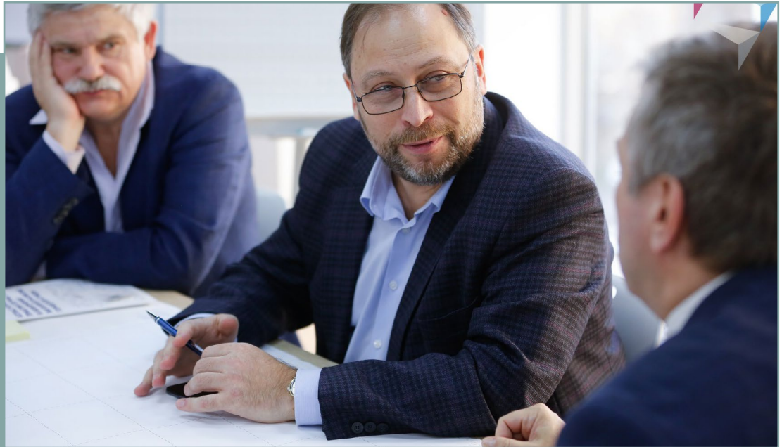
Проектная сессия в г. Москва по подготовке стандарта. 13 ноября 2019 года