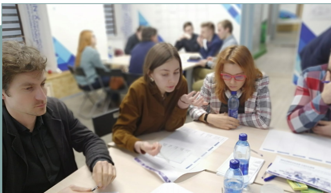
Проектная сессия в г. Ярославль по подготовке стандарта. 30 января 2020 года