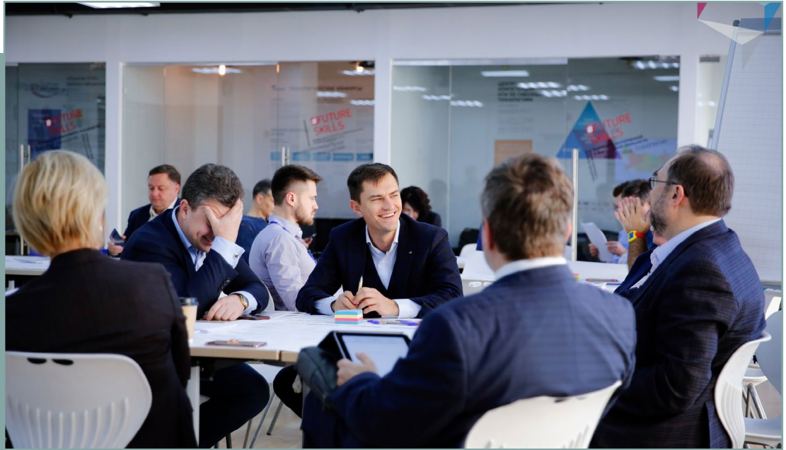
Проектная сессия в г. Москва по подготовке стандарта. 13 ноября 2019 года