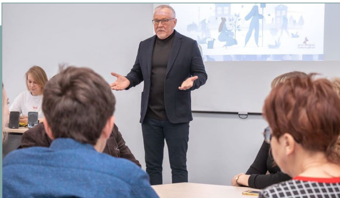
Проектная сессия в г. Тюмень по подготовке стандарта. 30 января 2020 года