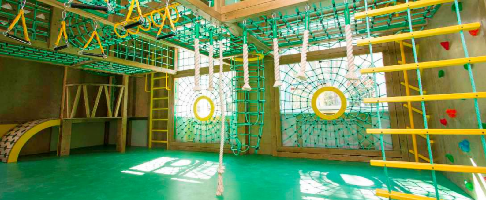
«ДЖУНГЛИ»-ЦЕНТР ДВИГАТЕЛЬНОЙ АКТИВНОСТИ И ЛЕЧЕБНОЙ ФИЗКУЛЬТУРЫ | 2014