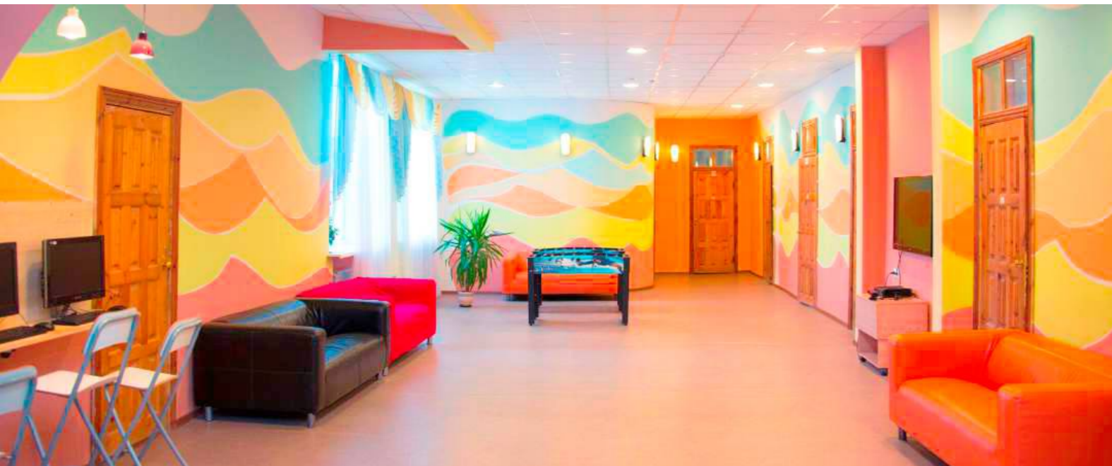
ШКОЛЬНЫЕ ХОЛМЫ | 2012-2017