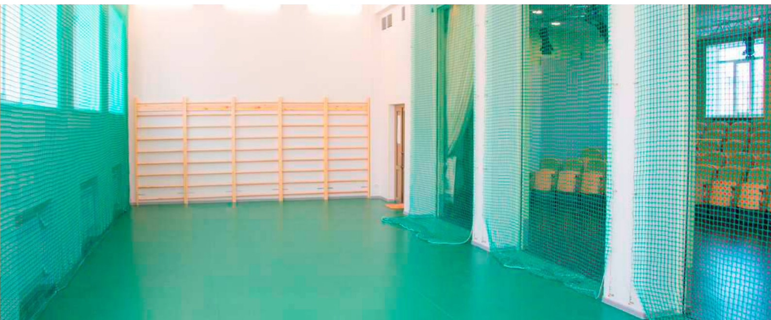
СПОРТИВНЫЙ ЗАЛ | 2014