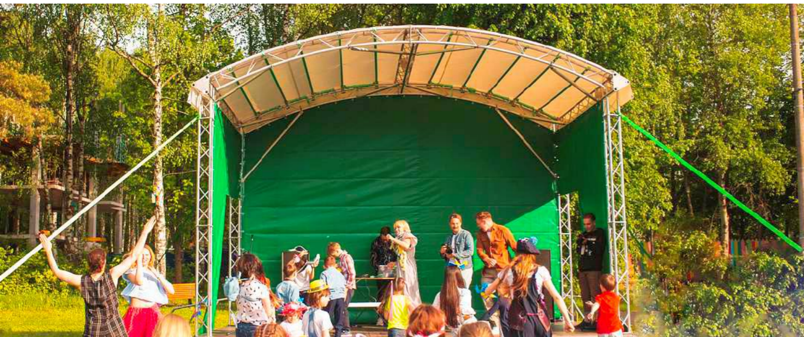
ФЕСТИВАЛЬНАЯ СЦЕНА | 2018