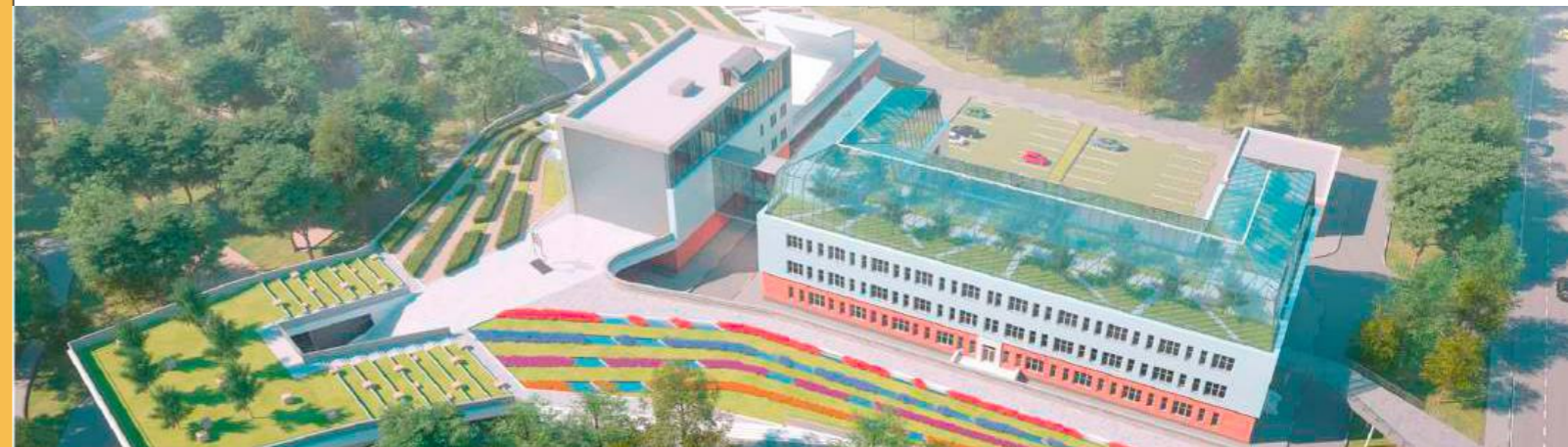
Это визуализация МЕЧТЫ, которую еще следовало воплотить