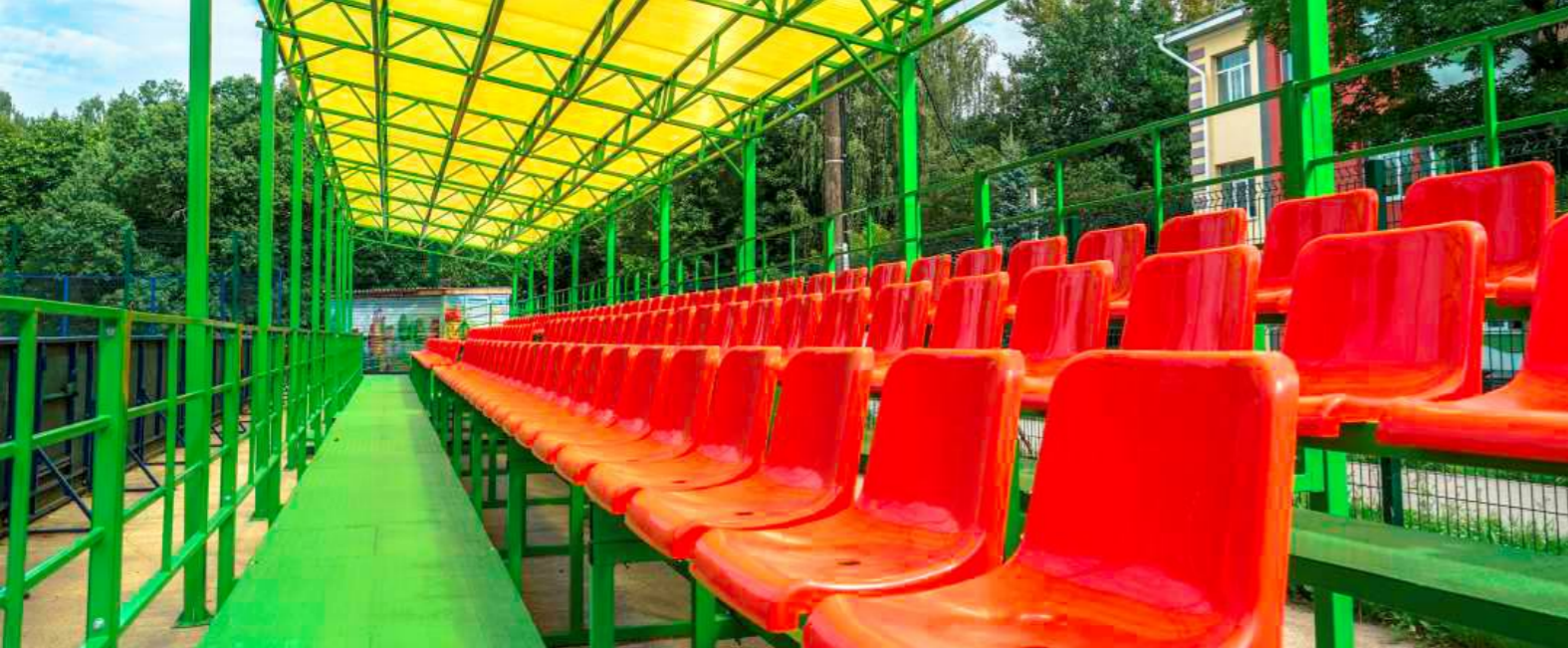
СПОРТИВНЫЕ ТРИБУНЫ | 2018