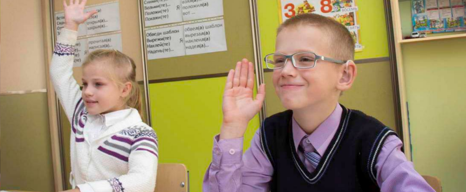
УЧЕБНЫЙ КЛАСС | 2014