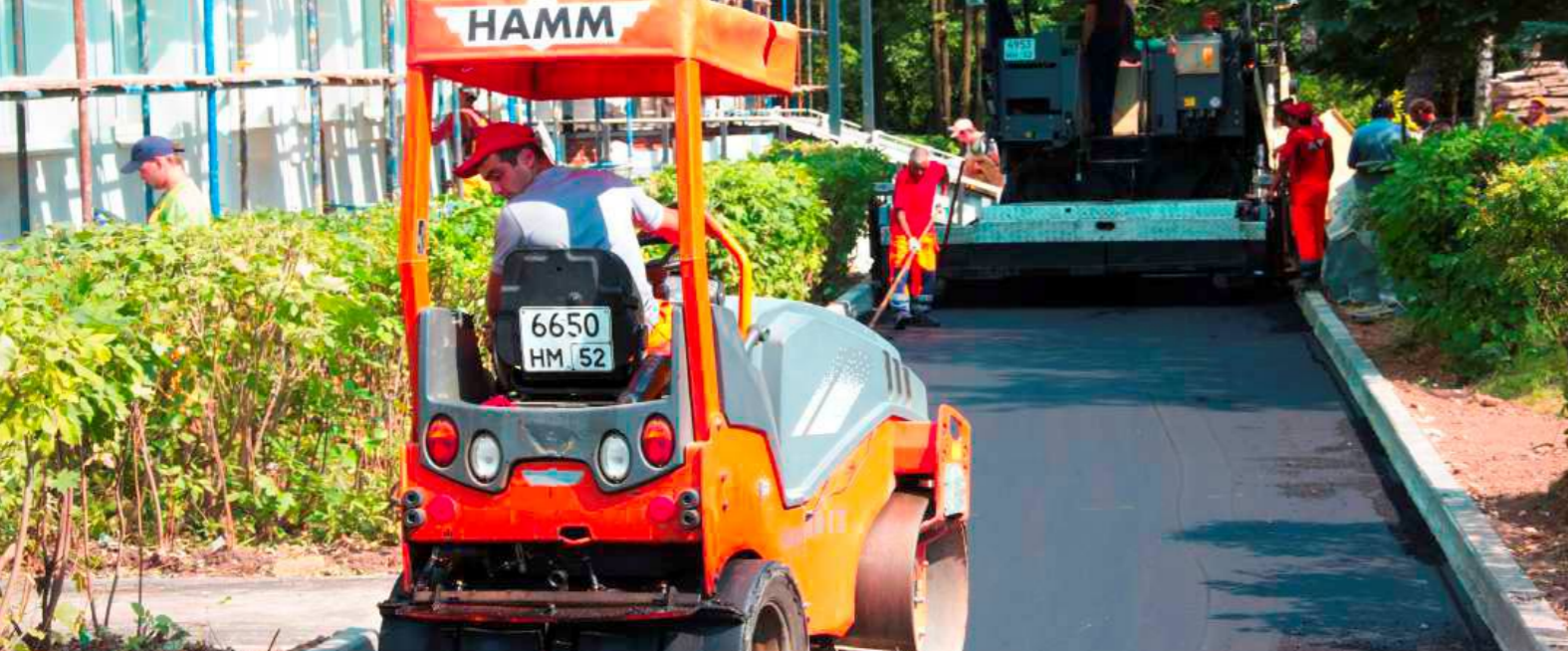
НОВАЯ ДОРОГА | 2014