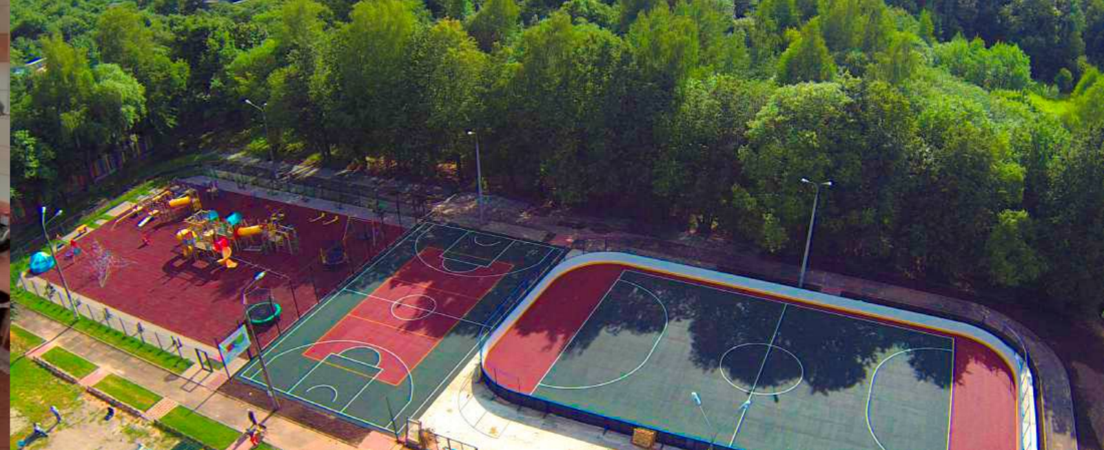
«ТЕРРИТОРИЯ ИГРЫ»-ИГРОВОЙ СПОРТИВНЫЙ КОМПЛЕКС | 2013-2014