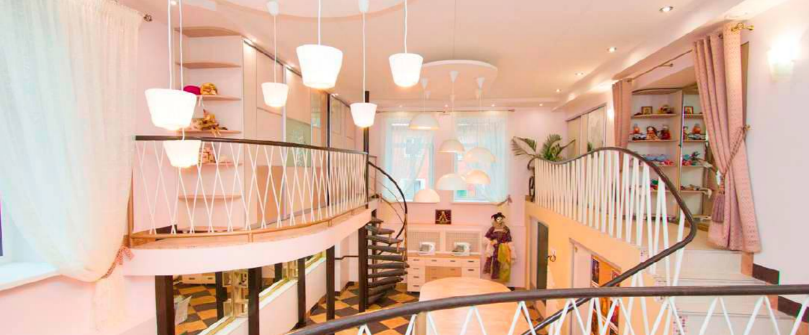
«АТЕЛЬЕ КОЛОМБИНЫ»-КЛАСС ТЕХНОЛОГИИ | 2014