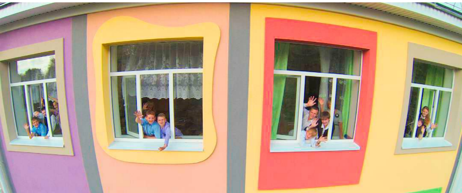
НОВЫЕ ОКНА | 2014