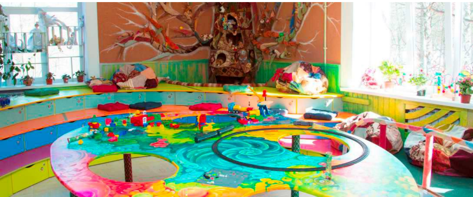
«НАУТИЛУС»-ИГРОВОЙ КЛАСС | 2013