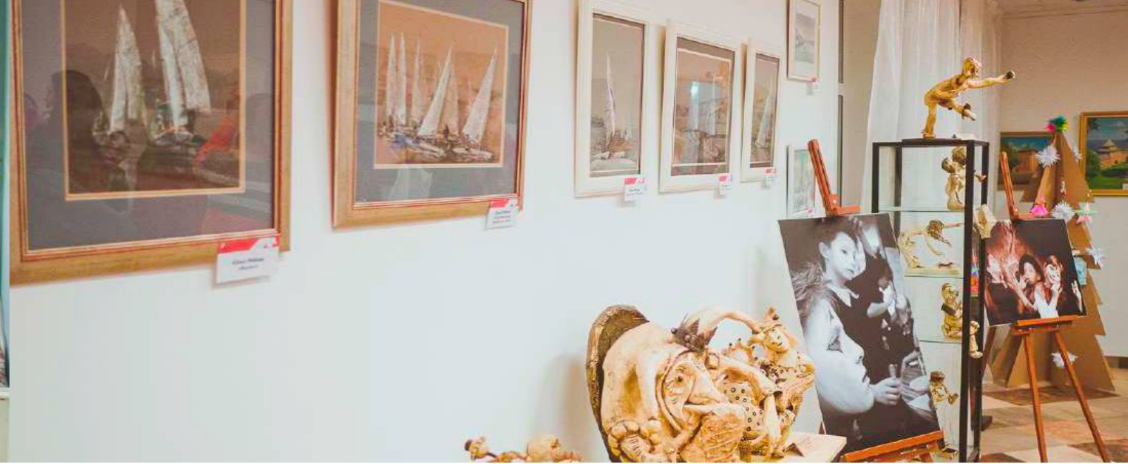
ШКОЛЬНЫЕ ХОЛМЫ | 2012-2017