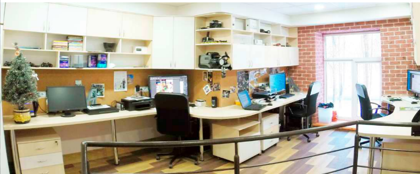
МЕДИА-СТУДИЯ | 2015