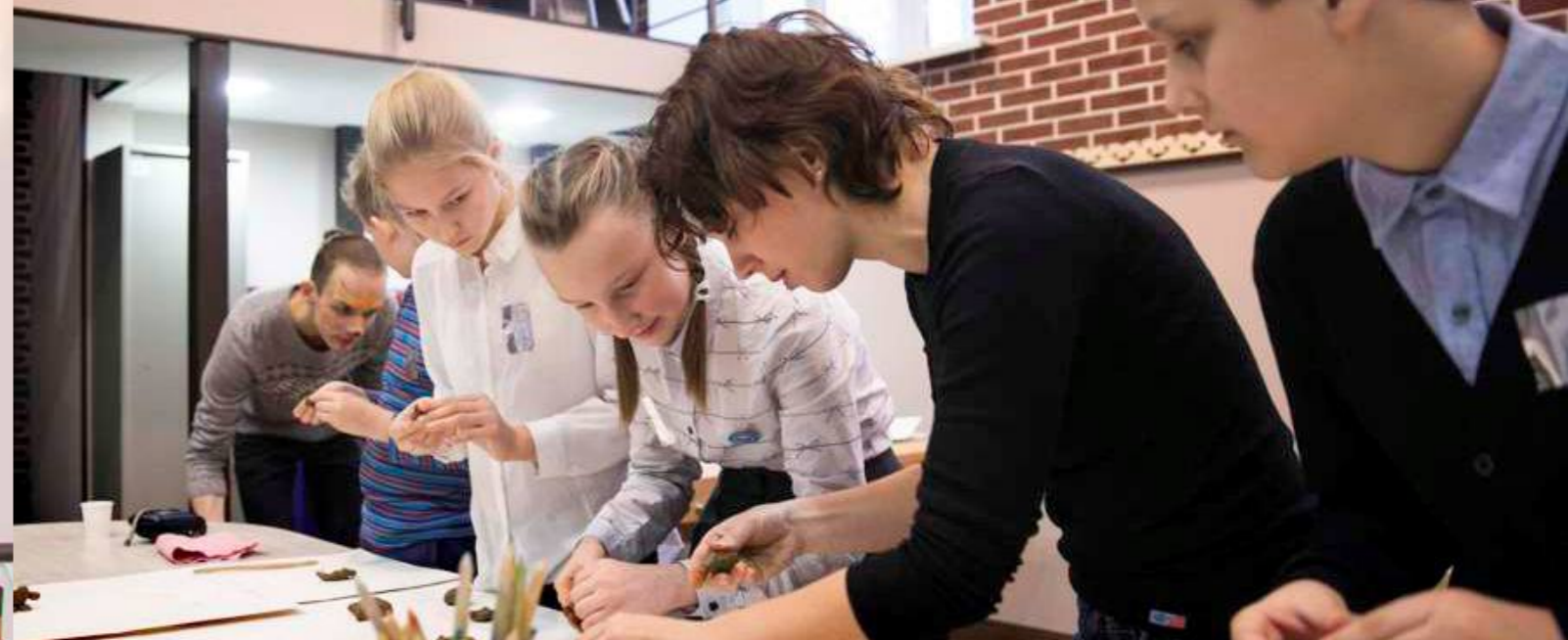
«МАСТЕРСКАЯ ЛЕОНАРДО»-КЛАСС ТЕХНОЛОГИИ | 2014