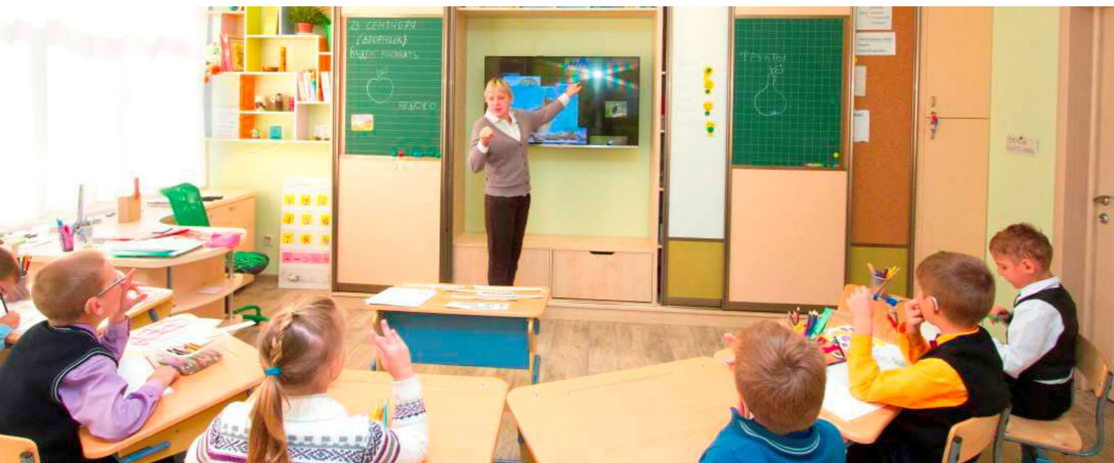
УЧЕБНЫЙ КЛАСС | 2014