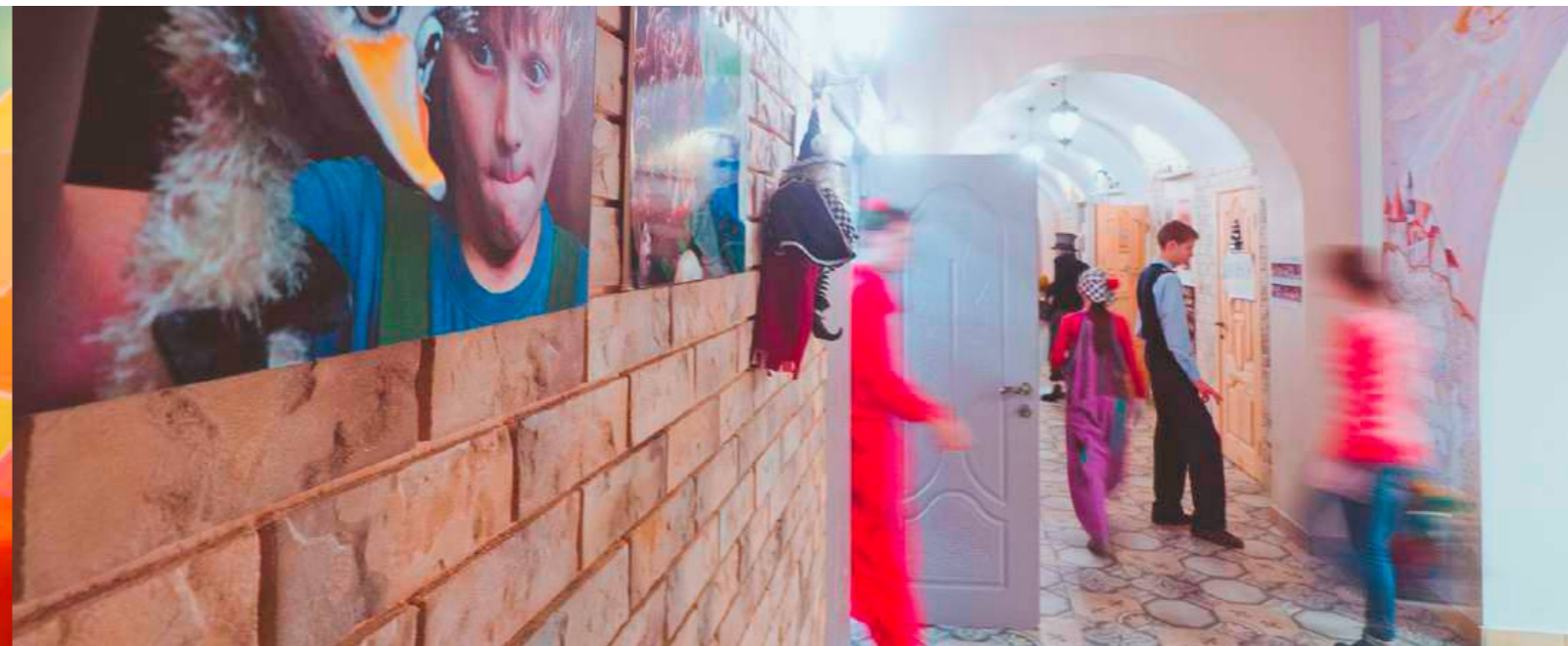
ШКОЛЬНЫЙ КОРИДОР | 2012-2017