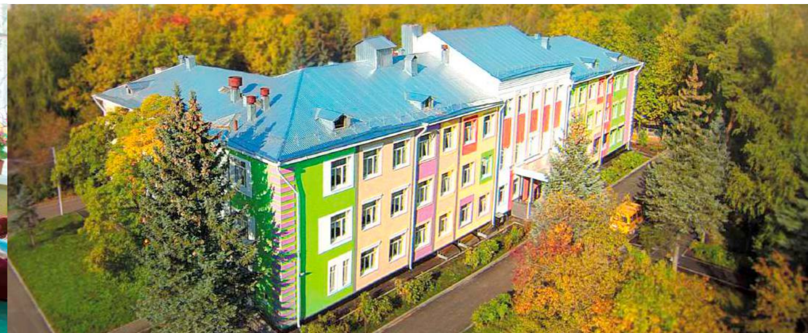
НОВЫЕ ФАСАДЫ | 2014