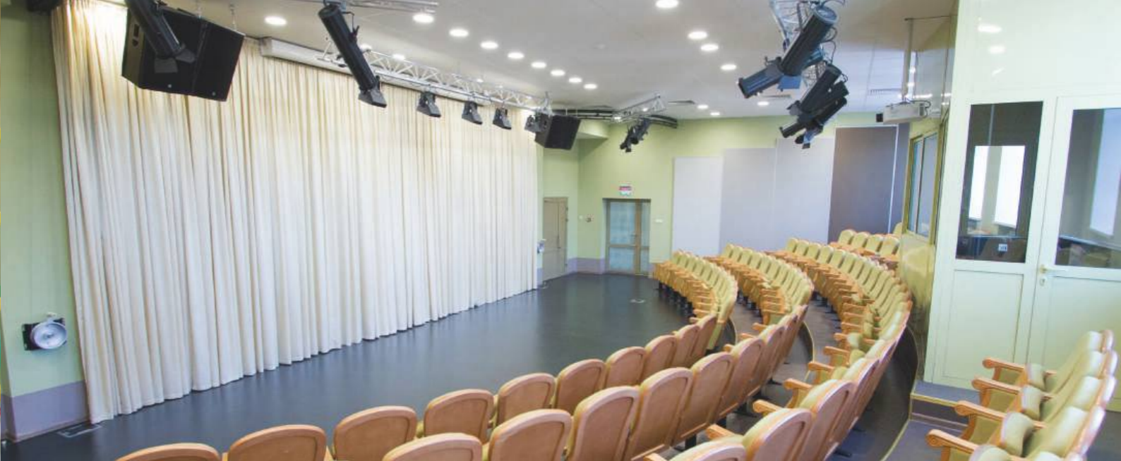
БОЛЬШОЙ ТЕАТРАЛЬНЫЙ ЗАЛ | 2014