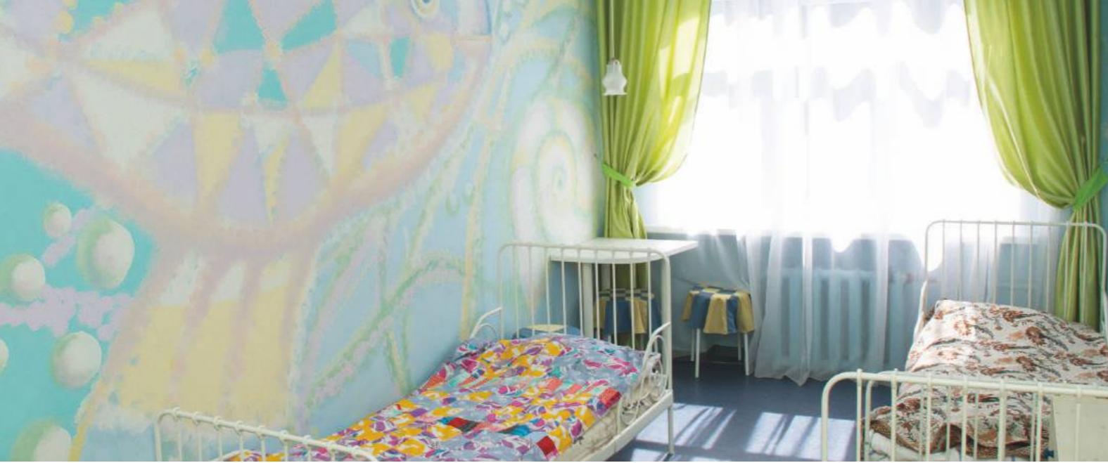
ДЕТСКИЕ СПАЛЬНИ | 2011