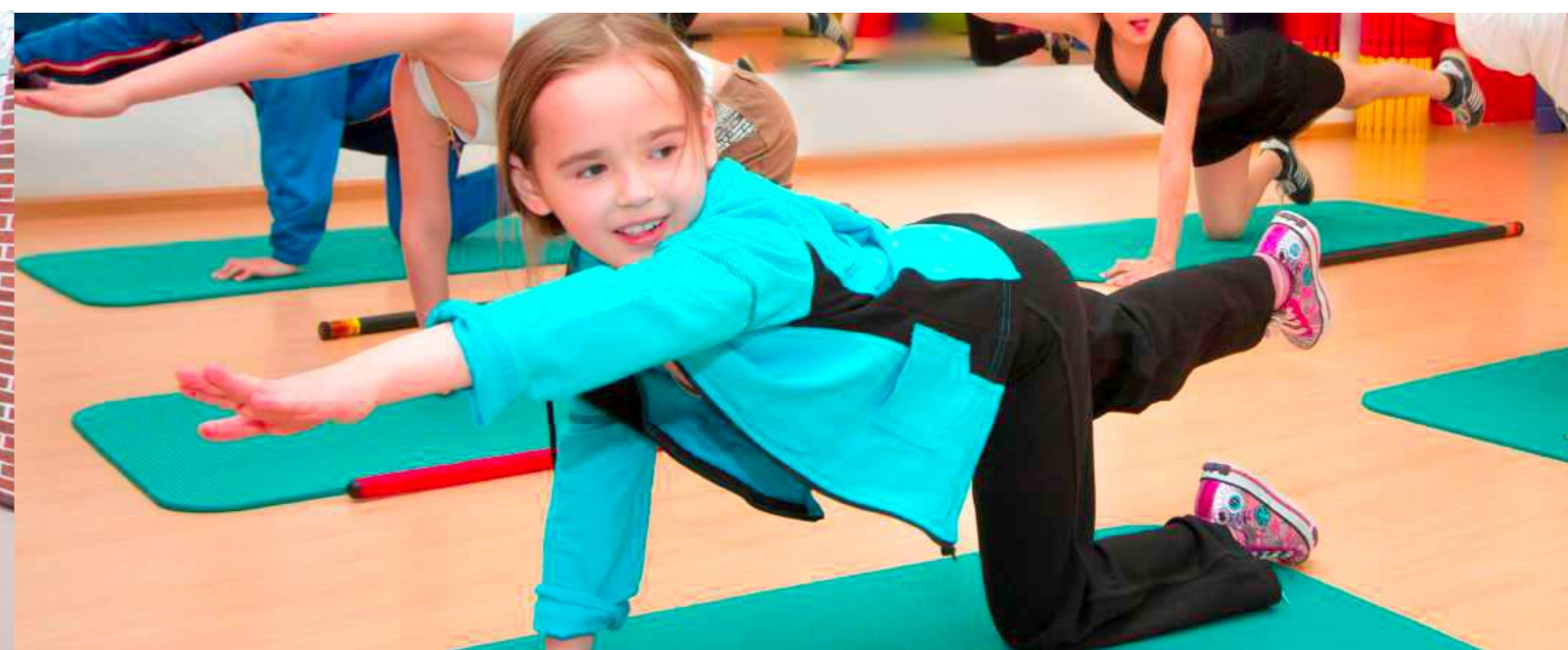
«ЗДОРОВЫЕ ДЕТИ»-МЕДИЦИНСКИЙ ЦЕНТР | 2017