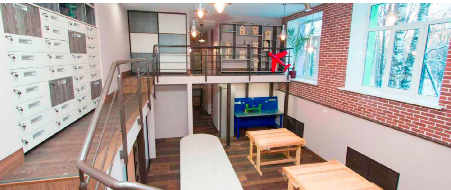
«МАСТЕРСКАЯ ЛЕОНАРДО»-КЛАСС ТЕХНОЛОГИИ | 2014