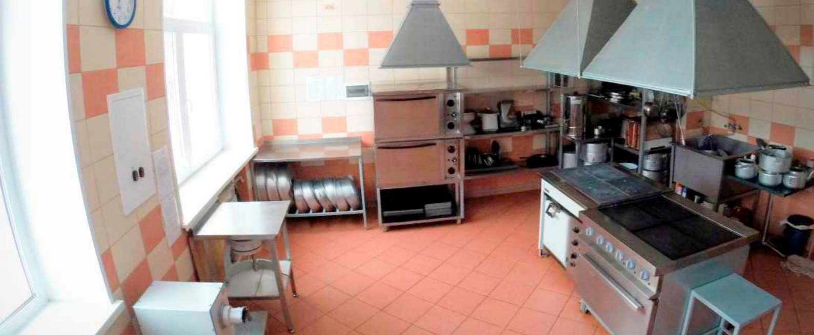
ШКОЛЬНАЯ КУХНЯ | 2012