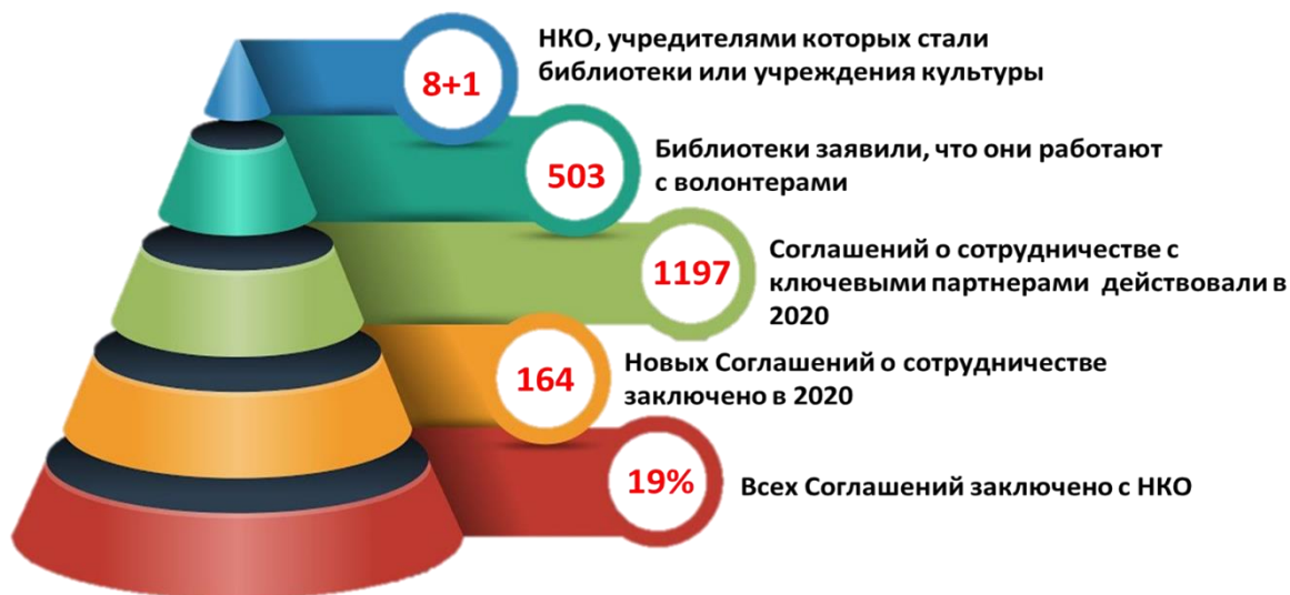
Рисунок 6. Развитие партнерского взаимодействия в рамках Большого проекта

общедоступных библиотек Иркутской области, силами которых в 2020 году проведено 49 волонтерских мероприятий.