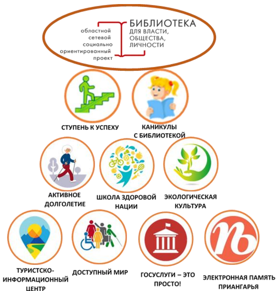
Рисунок 1. Подпроекты Большого проекта