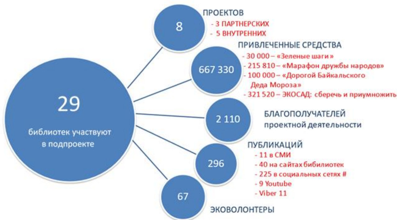
Рисунок 4. Основные результаты деятельности по подпроекту «Экологическая культура» 2020

Основные результаты деятельности по подпроекту представлены на рис. 4.