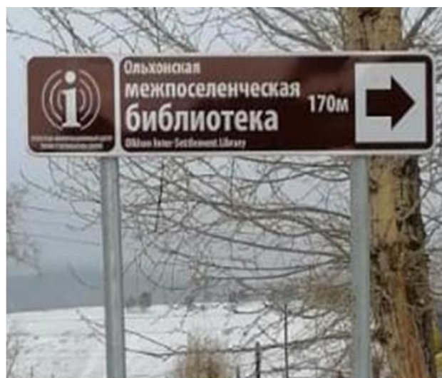
Рисунок 3. Знаки туристической навигации – ТИЦ в библиотеках