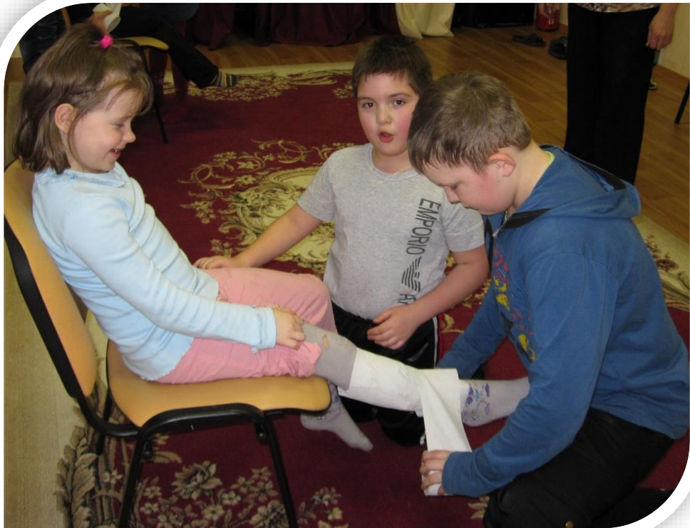
Оказание первой доврачебной помощи