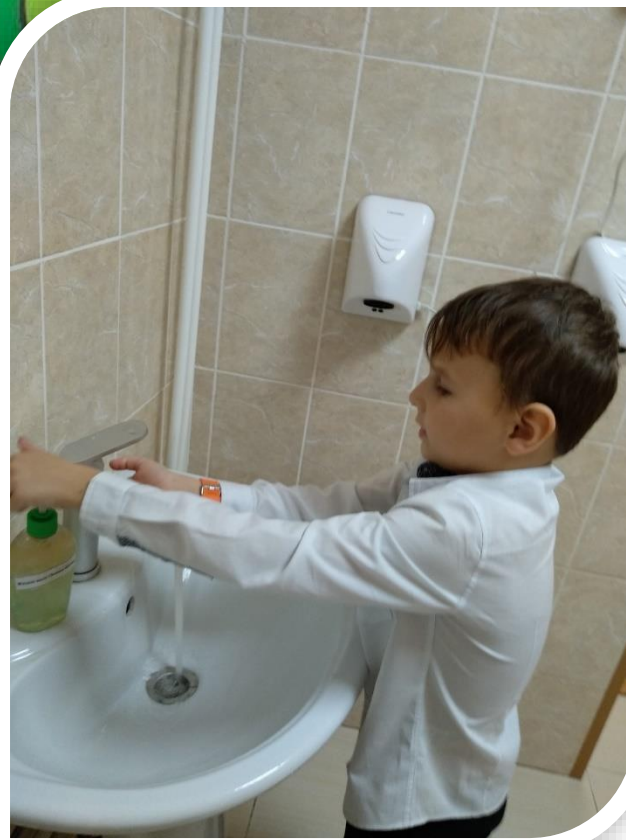
Занятия на укрепление знаний по правилам личной гигиены