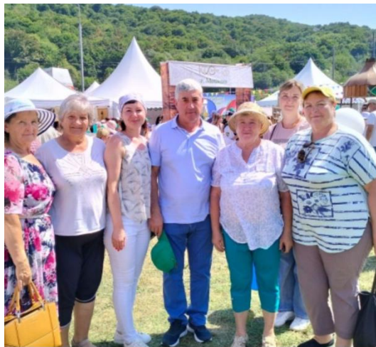
Министр труда и социального развития Республики Адыгея Мирза Д.Р.