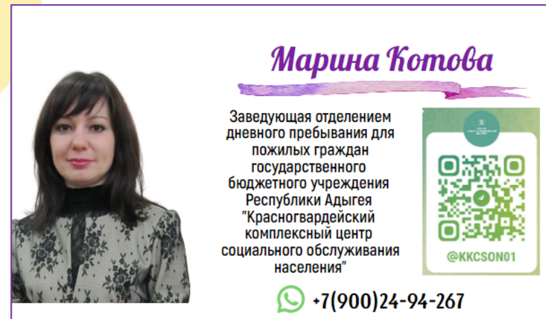
По совместительству наставник проекта и размещает статьи о проекте в «Телеграмм»