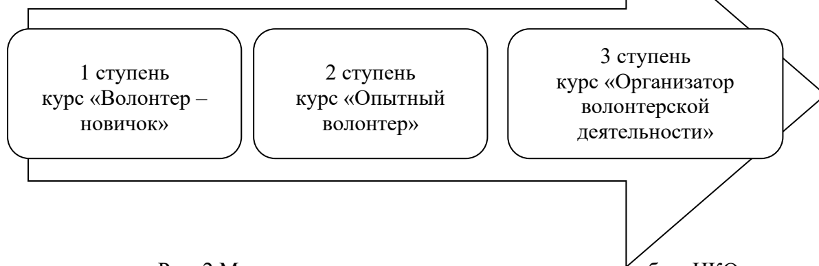
Рис. 2 Модель школы социального волонтерства на базе НКО