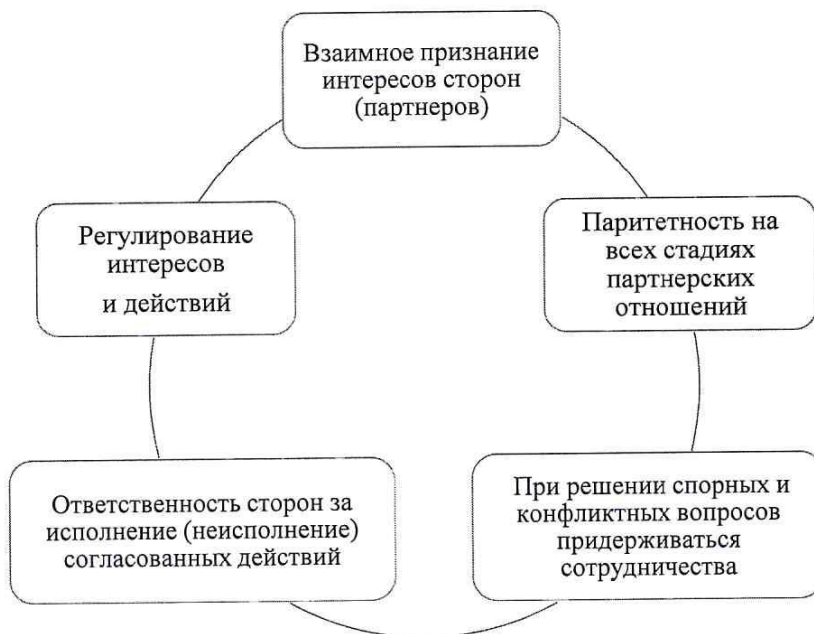
Рис.1. Основные принципы социального партнерства.

Социальное партнерство между различными структурами базируется на пяти основных принципах, которые отражены на рисунке 1.